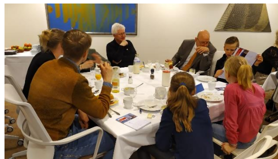
Statenleden interviewen tijdens de lunch.