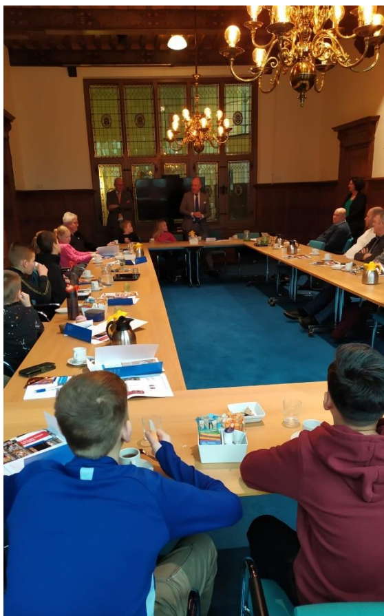
Ontvangst door de Commissaris van de Koning.

de Kring. We gingen op bezoek bij de Provinciale Staten! We maakten kennis met de Commissaris van de Koning, woonden een vergadering bij, kregen een rondleiding en mochten tijdens de lunch Statenleden bevragen. Wat een unieke kans!