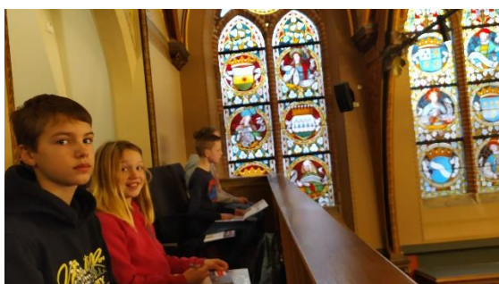
Vergadering bijwonen in de prachtige Statenzaal.