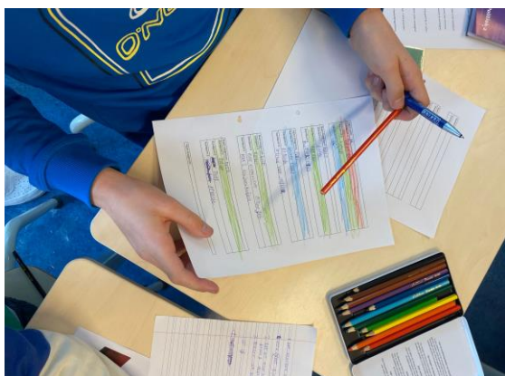
Leerlingen noteren de gepitchte standpunten en sorteren overeenkomstige standpunten om partijen te kunnen vormen.

De leerlingen schreven een partijprogramma en voerden campagne. Uiteindelijk vonden de verkiezingen in de klas plaats. Ouder(s)/verzorger(s) kregen voorafgaand de mogelijkheid om de proefpresentaties bij te wonen en feedback te geven. In dit blok stonden samenwerken, beargumenteren en leren presenteren centraal.