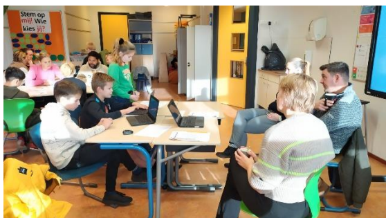
De leerlingen die les krijgen op CBS In de Kring houden een proefpresentatie voor hun ouder(s)/verzorger(s).